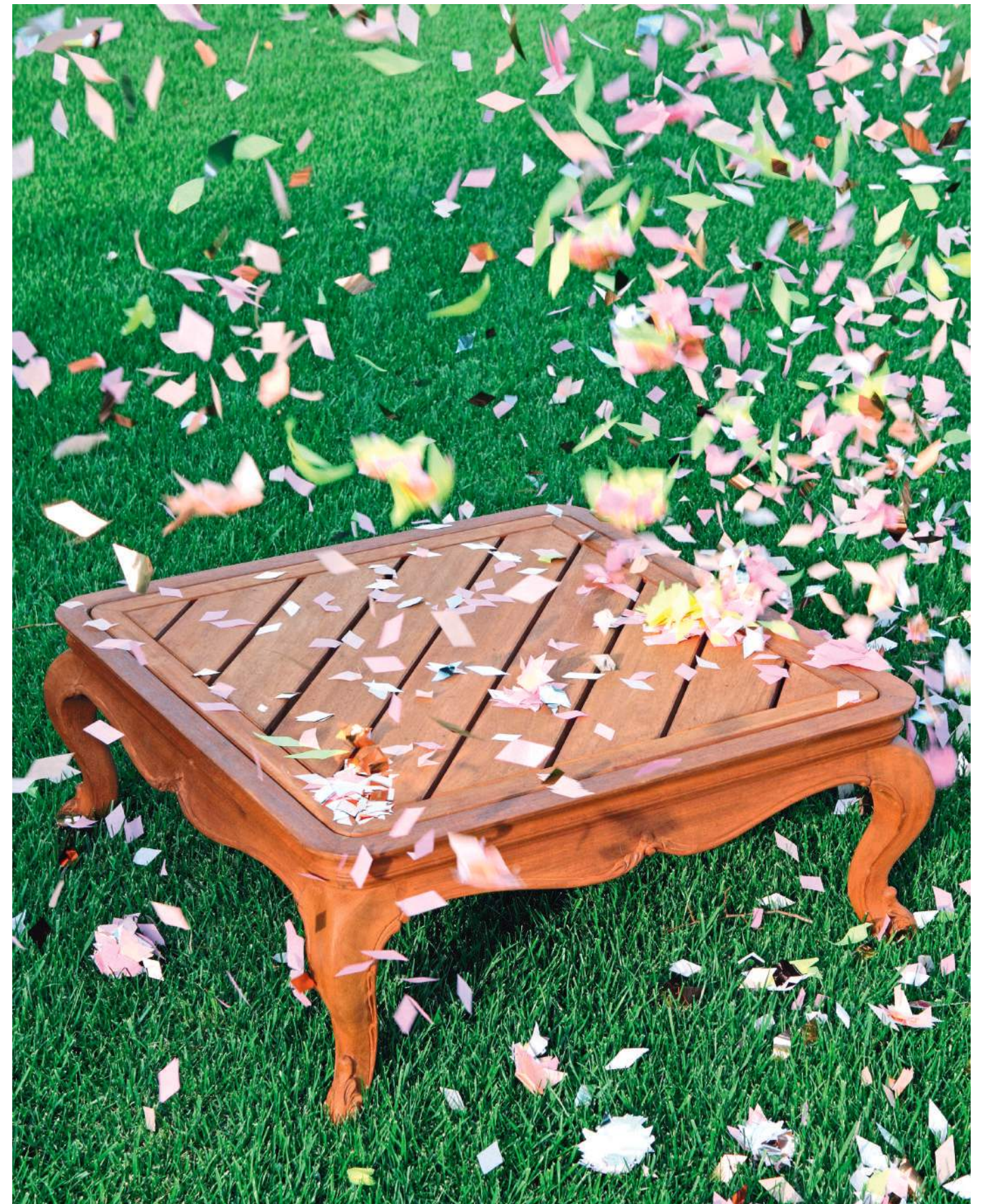
Tra gli alberi. Tavolino della collezione Outdoor di Chelini in mogano sipo, legno molto resistente agli agenti atmosferici. Finitura décapé antico (2.570 €). Della linea, ispirata allo stile Luigi XV, fanno parte anche un divano, una poltrona, una chaise-longue, un tavolo da pranzo con sedie. Coriandoli fatti a mano ConfettiSystem (18 €).