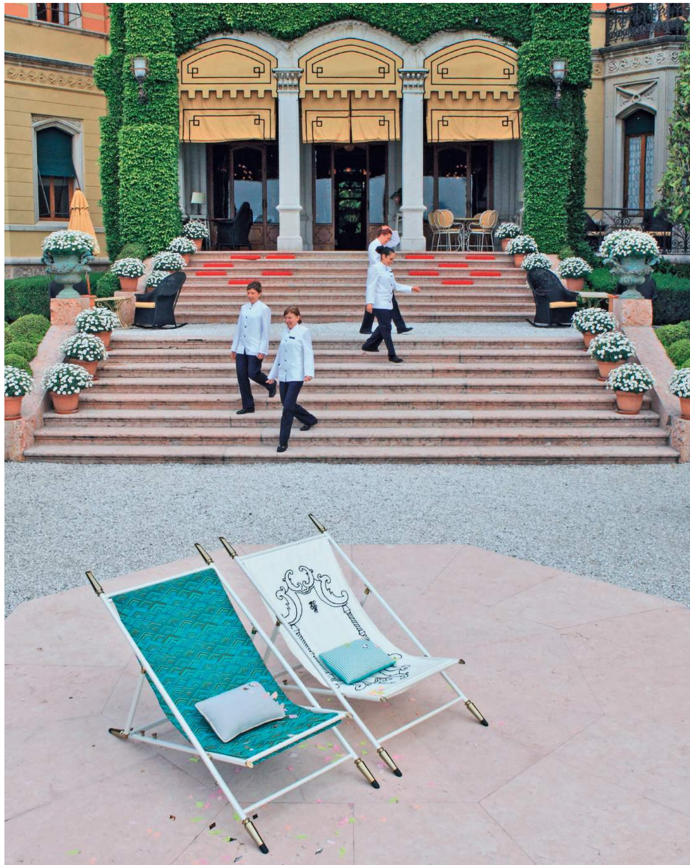
Fronte lago. Davanti all'ingresso dell'albergo, le sdraio Aydon di Alessandro La Spada per Visionnaire. Acciaio laccato con dettagli preziosi. Tessuti: da sinistra, Parade e Venice . Cuscini con tessuti Dedar: Modo in lana a sinistra (151,60 € al metro), Dialogo , ignifugo e ingualcibile, a destra (134 € al metro). Coriandoli ConfettiSystem (18 €).