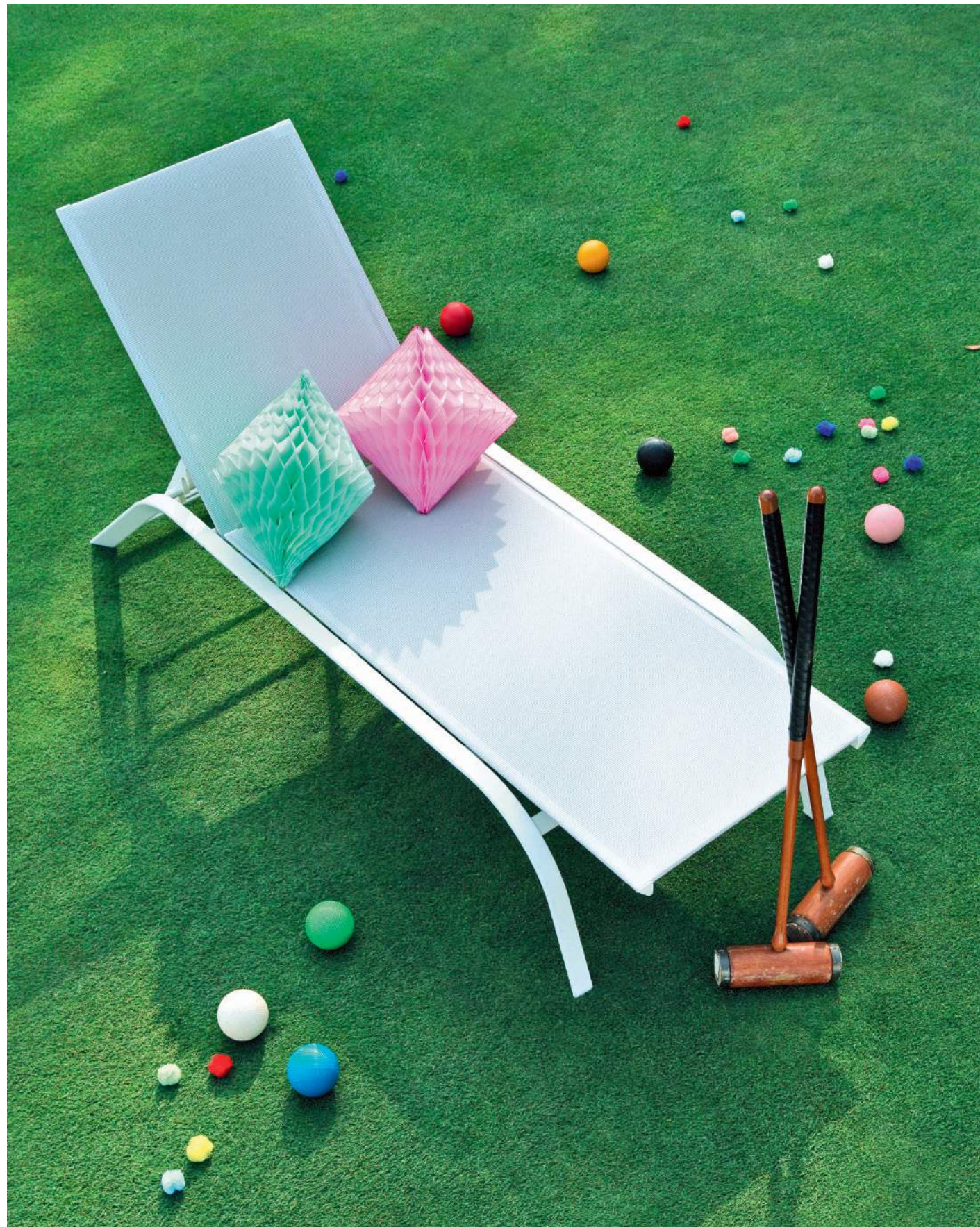
Al sole. In mezzo al campo da croquet il lettino Panarea di Unopiù. La struttura in alluminio è rivestita con un innovativo tessuto tecnico che vanta la resistenza del pvc e la morbidezza della ciniglia di poliestere (480 €). Festoni di carta PartyParty di ConfettiSystem (da 16 €), pompon Meri Meri da www.babybottega.com (10 €).