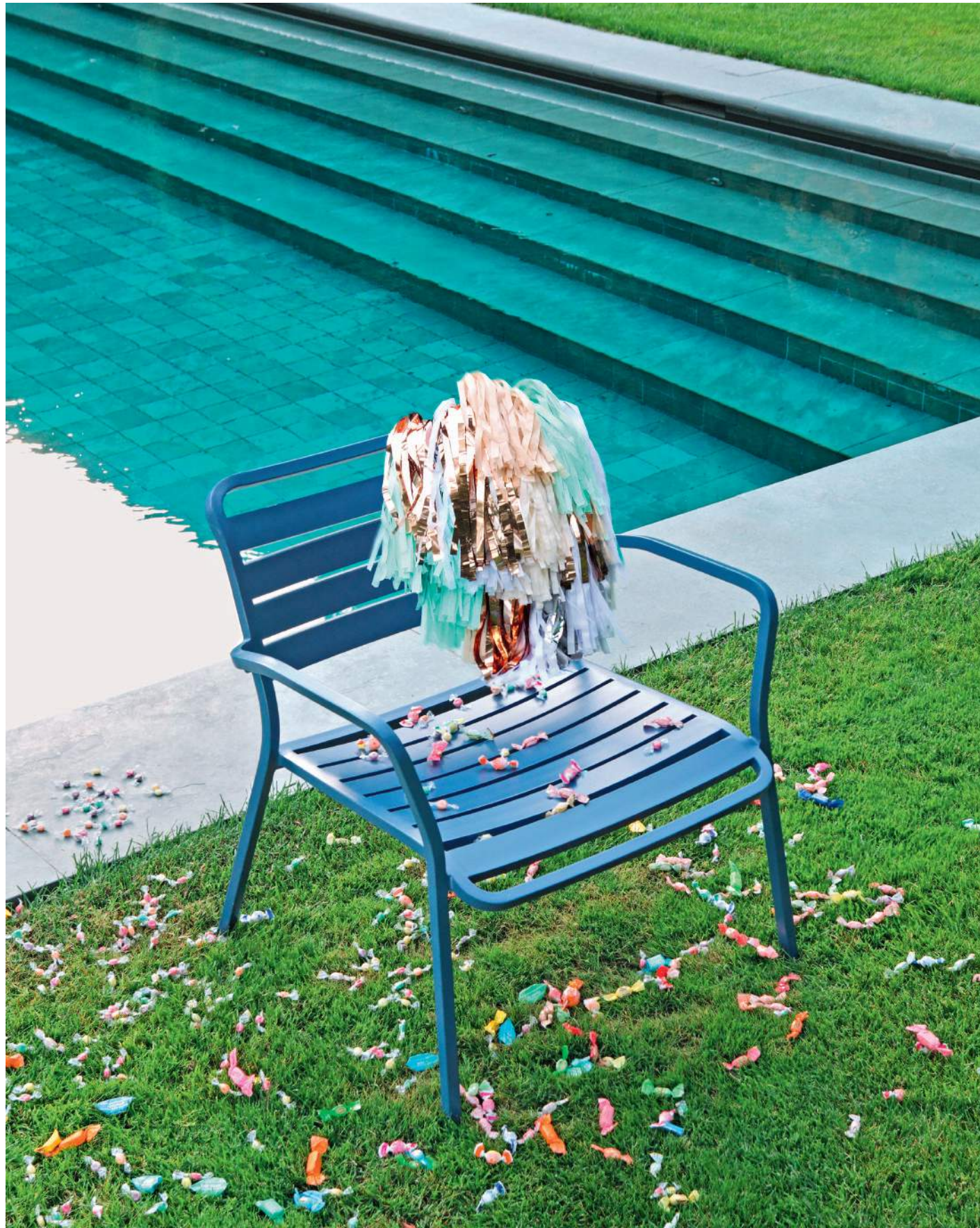
Bordo piscina. Poltroncina lounge Ocean blu iris di Ethimo (280 €). Interamente realizzata in alluminio, la linea Ocean comprende anche lettini prendisole e tavoli dotati di foro centrale per l'ombrellone. Festone di carta colorata Garland di ConfettiSystem (128 €).