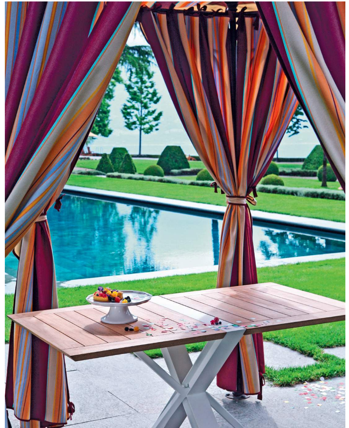
Il gazebo. Il tavolo Traverse di Royal Botania progettato da Mathias De Ferm rivisita il tradizionale modello inglese del gateleg table. Piegato a metà è perfetto per due persone, aperto accoglie sei commensali. Base in alluminio verniciato e piano in teak (1.749 €). Coriandoli a bolli Meri Meri da www.babybottega.com (20 €).